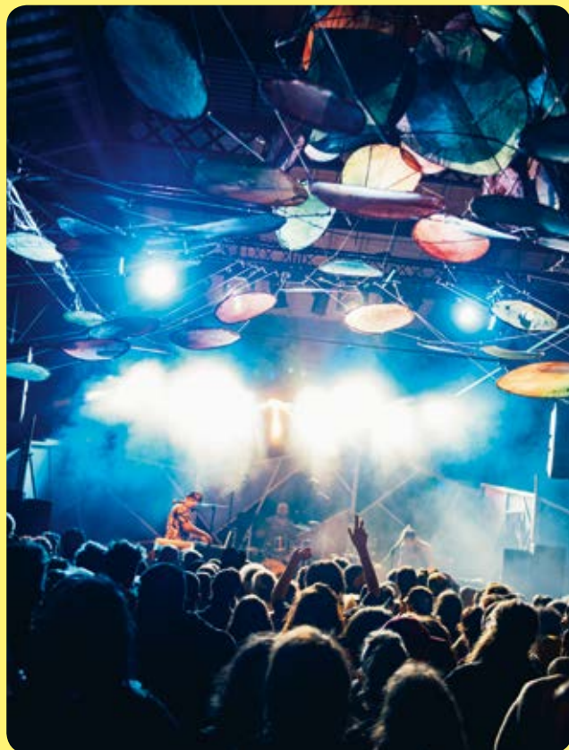
FESTIVAL 2023 - CONCERT RECO RECO