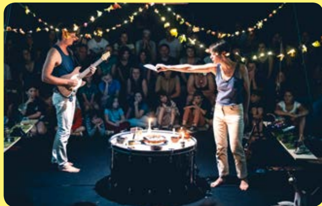
FESTIVAL MIMA 2023 SOUS TERRE - CIE MATILOUN